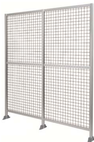
2枚連結した『AZ2』 (最も人気の高さ2,150mmタイプ)