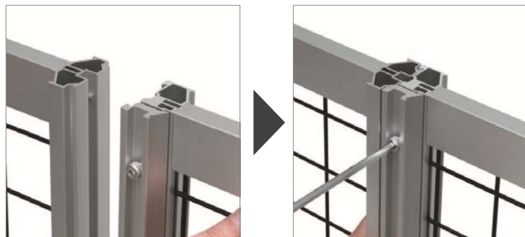
連結は、形の異なる2種類のフレームを組み合わせて ボルトを締めるだけ