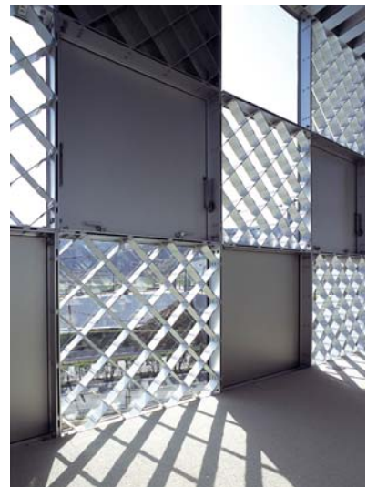
▲アルミ製ラチスパネル

ラチスパネルは、十字形の押出材をトラス構造に組み、それをパネル化したものです。パネルの厚さを変えることで用途に応じて強度の調整が可能で、壁面などに多く使われています。ショーケースでは、厚いラチスパネルを柱のように利用することで、シャンデリアの鑑賞を邪魔することなく、吹き抜けの大空間を実現できました。