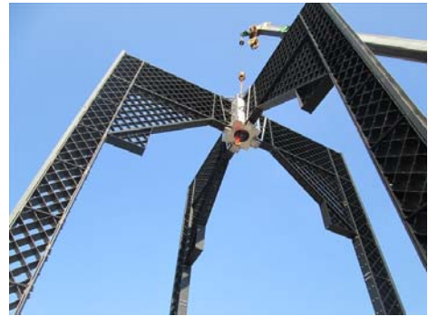
▲昨年の仮組みの様子

塗装には、粉体塗装という技術が用いられています。粉末状の塗料を被塗物に付着させ、高温の炉内にて焼き付けることにより完成する技法で、有機溶剤(アルコール・シンナー等)を使わない環境に優しい塗装方法です。